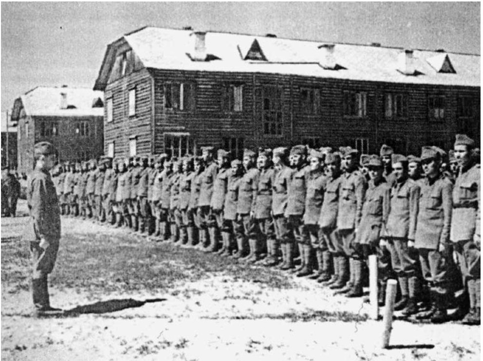
Prizonieri români. 1944

The author reveals historical events and people left behind. He tries to do that for Romanians deported, exiled and taken prisoners on the Soviet territory in order to give the reader an overview of the problem of Soviet GULAG prisoners.